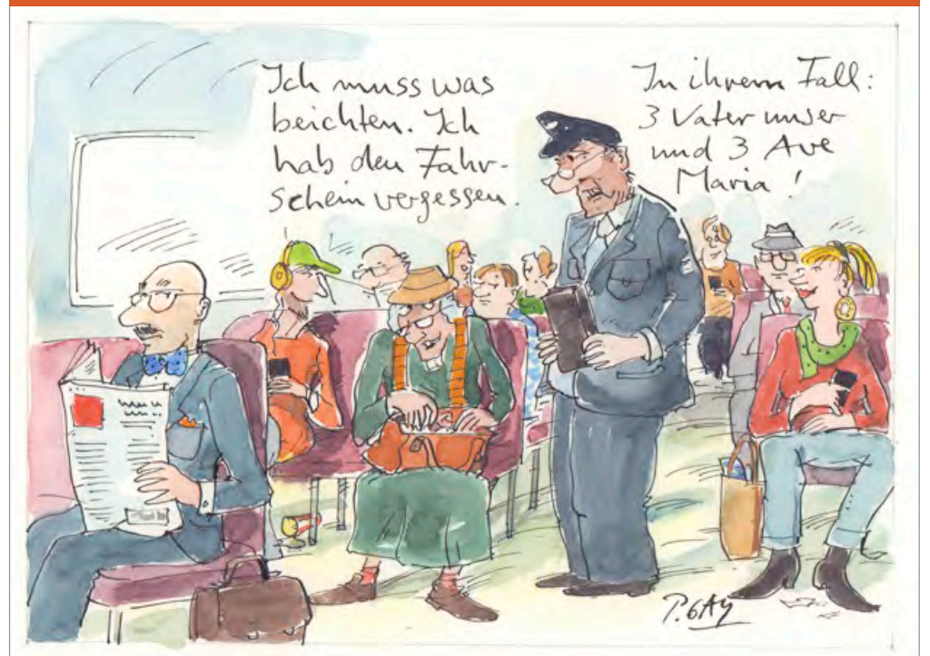
© Peter Gaymann, www.demensch.gaymann.de / Die Zeichnung stammt aus dem DEMENSCH-Kalender 2019.