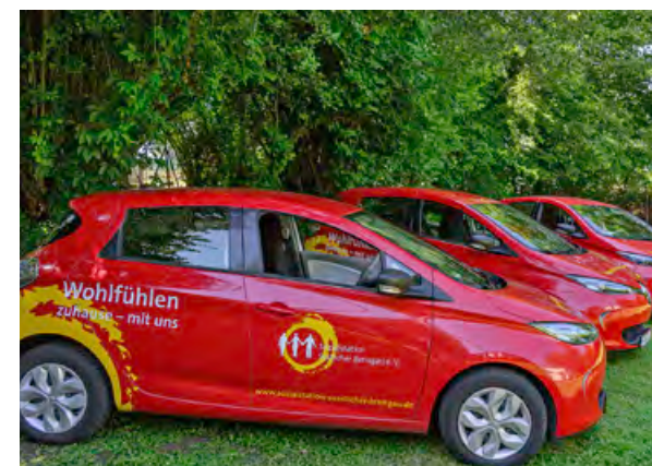
Wir kommen zu Ihnen – auch in Zeiten von Corona.

An unser Gebäude angeschlossen ist ein echter Hingucker: ein als Ring gestalteter Hochgarten (im Modell mittig). Er erlaubt auch dann Kontakt und Teilhabe, wenn wie jetzt Abstand und soziale Isolation nötig